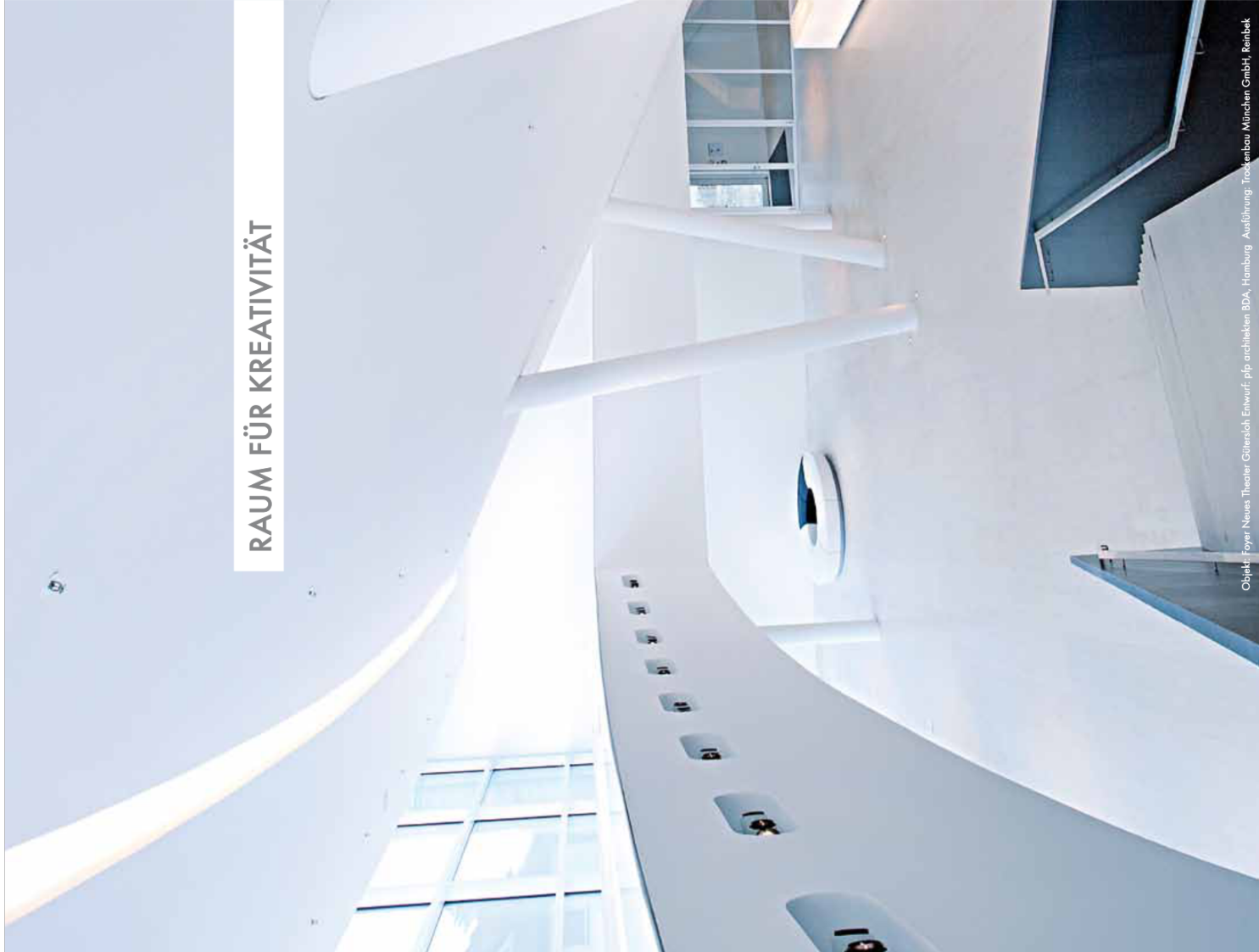
Objekt: Foyer Neua, Theater Götterloht Entwurf: plp architekten BDA, Hamburg Ausführung: Trockenbau München GmbH, Rimbak